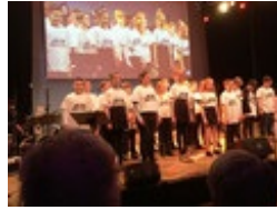
Schüler*innen des Martin Luther Gymnasiums