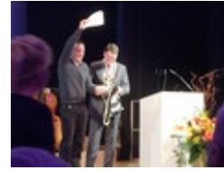
Verleihung der Ehrenurkunde des Oberbürgermeisters