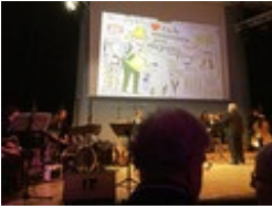
Vor dem Beginn des Empfangs