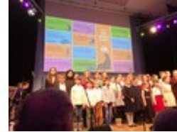
Schüler*innen des Martin Luther Gymnasiums