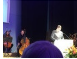
Neujahrsrede des OBM Torsten Zugehör