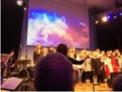
Schüler*innen des Martin Luther Gymnasiums