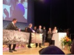
Ehrung des Ober- und des Bürgermeisters