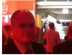
Während der Rede des Landrates