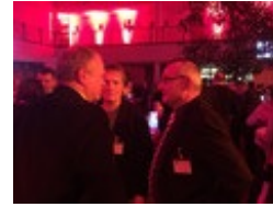
Gespräch mit Kreistags- und Stadtratsmitgliedern