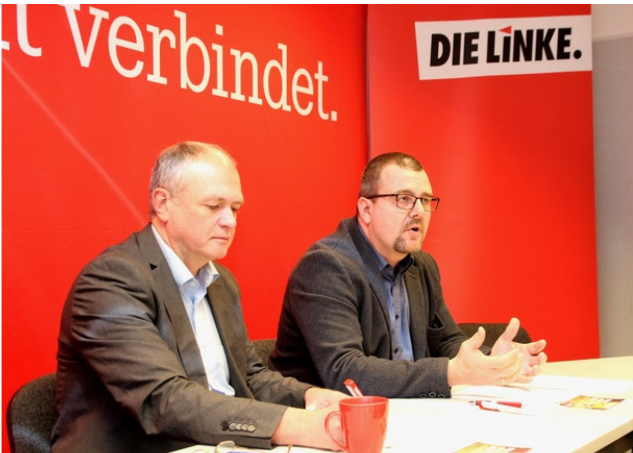
Foto: Thomas Lippmann (MdL) und Andreas Höppner (MdL & Landesvorsitzender) beim Pressegespräch

Januarklausur des Landesvorstandes mit der Landtagsfraktion stand ganz im Zeichen der Kommunal- und Europawahlen 2019.