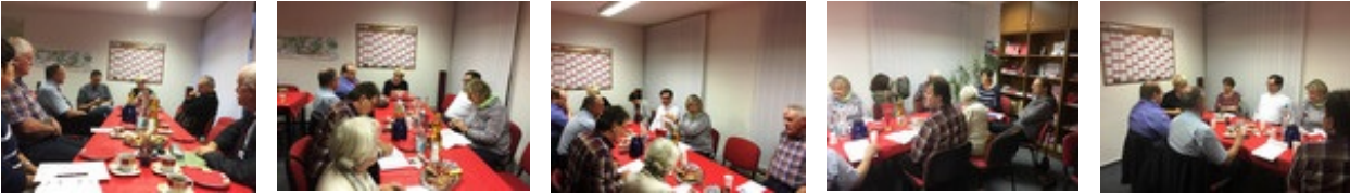
5 Fotos von den Beratungen

Lutherstadt Wittenberg. Am 10. Januar 2018 fanden Abstimmungen zur gemeinsamen Wahlkreisarbeit mit Birke Bull-Bischoff (MdB), die ihren Patenwahlkreis im Landkreis Wittenberg haben wird, statt. Gemeinsam mit den Fraktionen und dem Kreisvorstand wurden die nächsten Dinge beraten.